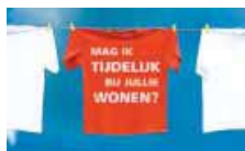
► De instellingen voor pleegzorg in

Noord-Holland (Parlan, OCK het Spalier en de Bascule) voeren vanaf vandaag een wervingscampagne voor nieuwe pleegouders. Zie www.pleeggezingezocht.nl . Komend najaar begint ook een landelijke campagne.