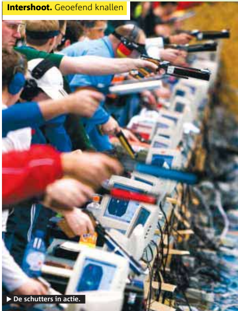
► De schutters in actie.