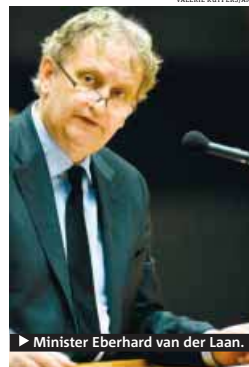
► Minister Eberhard van der Laan.